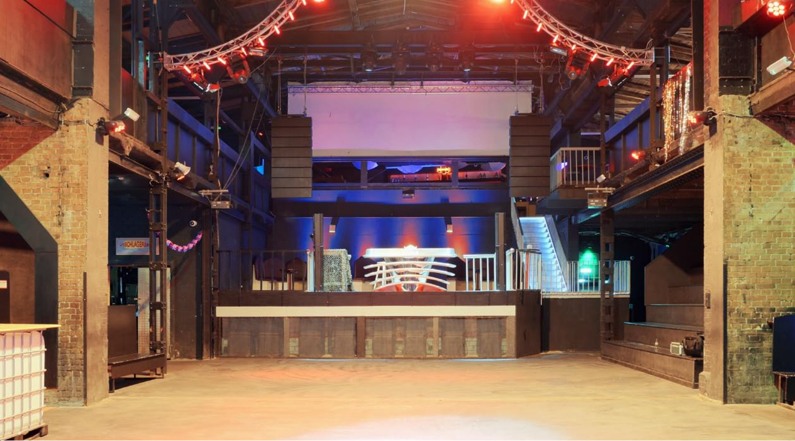
Ansicht der Bühne von der Tanzfläche aus

Stock gibt es eine umlaufende Galerie mit weiteren Bars und ruhigeren Zonen. An einer Stirnseite ist eine Bühne installiert, auf der normalerweise das DJ-Pult aufgebaut ist. Sie verleiht dem Jolly Time auch das mehrzweckhallenartige Basislayout. Optisch tritt das nicht so augenfällig in Erscheinung, wirkt sich aber natürlich auf die Nutzungsmöglichkeiten und die akustischen Randbedingungen aus.