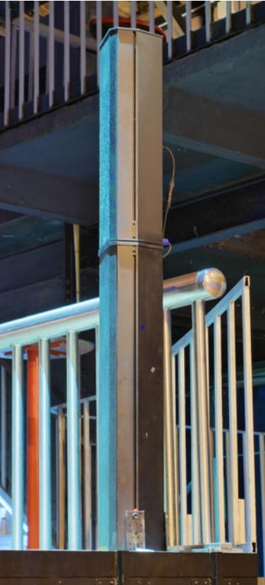
Pan Beam PB 224 als DJ-Monitor

Die Hochleistungsvarianten vertreibt Mundorf unter der Bezeichnung ProAMT, wobei für das Pan Acoustics System eine spezielle Ausführung zum Einsatz kommt. Dazu später mehr.