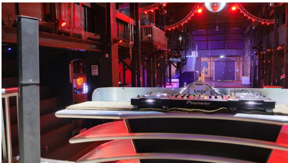
DJ-Arbeitsplatz mit Pan Beam Monitorsystem

vor einiger Zeit Kontakt mit dem Kölner Lautsprecherhersteller Mundorf aufgenommen, der neben höchstwertigen Frequenzweichenkomponenten mit dem ProAMT auch ein qualitativ sehr hochwertiges und gleichzeitig für PA-Zwecke pegeltaugliches Hochtonsystem im Programm hat, über das wir in Prosound bereits berichtet hatten.