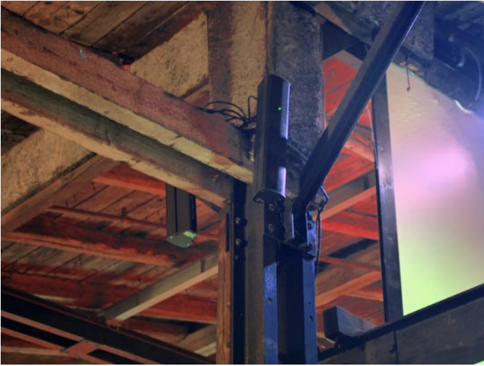
Pan Beam Linienstrahler vom Typ PB 04 und PB 08 werden auf der Galerie als Stütz- bzw. Delaysysteme eingesetzt.

Weise jedes einzelne der drei Teilsektionen des 8"-ProAMT bei dieser Frequenz vermutlich einen vertikalen Abstrahlwinkel von über 100° haben, so dass der von ihnen abgestrahlte Schall auch im Nahbereich vor dem Array erreicht. Dies wiederum ist die Voraussetzung dafür dass das Beam-Forming auch im Hochtonbereich im vorderen Teil der Hörerfläche gut funktioniert.