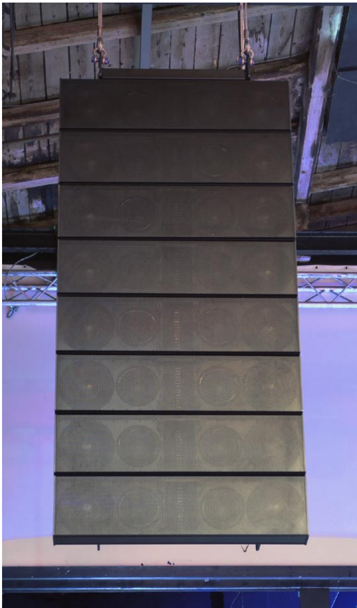
Frontansicht eines der Pan Beam Line-Arrays

gehen, zwar eine gleichmäßige Versorgung sicherzustellen, sich dann aber mit mittelmäßiger Tonqualität zufriedengeben. An dieser Stelle spielt auch die Qualität der Lautsprecherkomponenten eine wichtige Rolle – zusammen mit der Tatsache, dass man diese mit Hilfe einer integrierten DSP-Technik bestmöglich ansteuern können sollte.